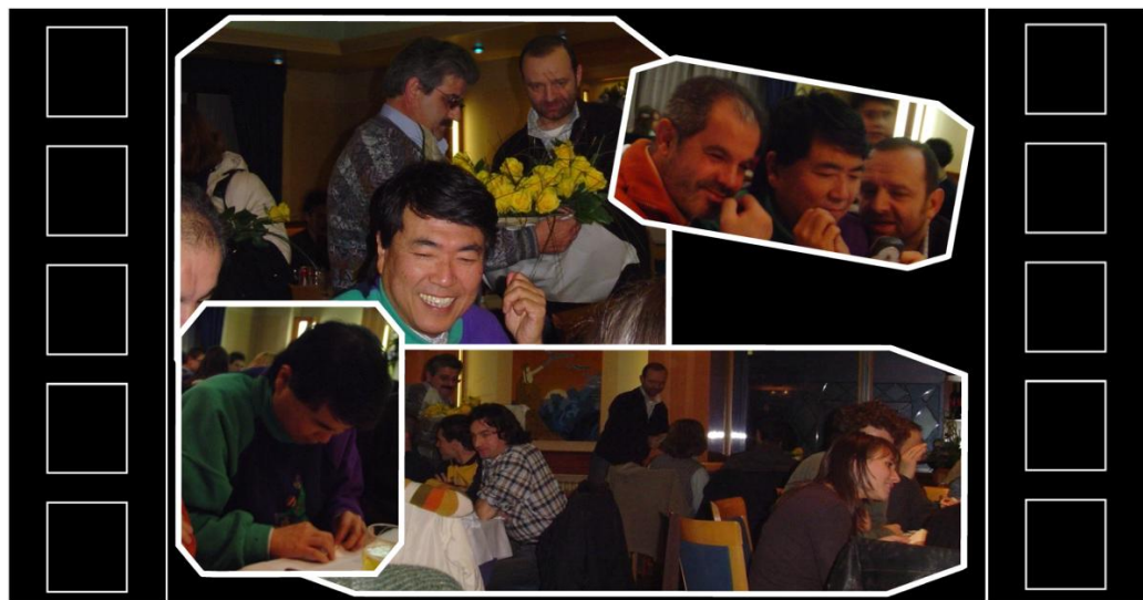
Alcuni momenti della cena Natalizia dell'A.I.S.

Sarà un seminario impegnativo, ma anche una tappa fondamentale per la crescita degli studenti.