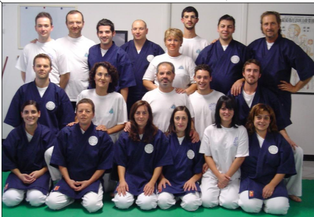
durante il seminario di Shiatsu per il primo e secondo anno